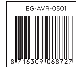
Barcode sticker size: 40x35 mm